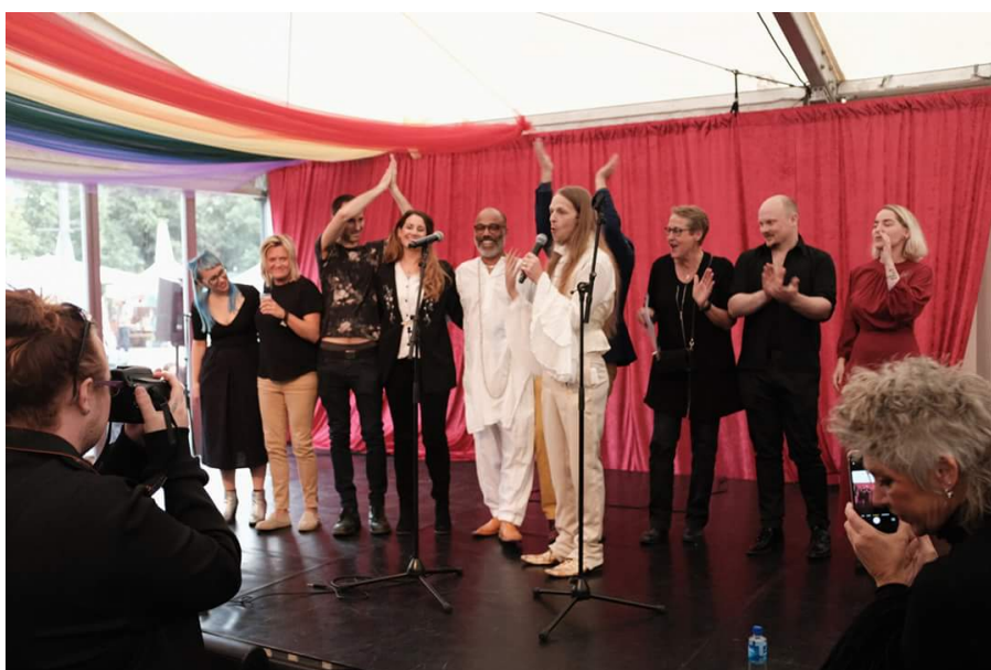
Faggruppa i Pride Art. De har lagt ned et enormt arbeid sammen med dedikerte frivillige for å gjøre utstillingen mulig.

Jeg har fulgt prosessen opp mot utstillingsåpningen på Facebook. Det er bare å ta av seg tiaraen og bøye seg i glitteret for frivilligheten. Om dugnadsånden er på hell her til lands, så er Pride Art et fargesprakende, høytropende unntak. Det er åpenbart at veldig mange mennesker har lagt ned et imponerende stykke arbeid for å realisere dette, og de skal takkes for det - ikke bare på grunn av innsatsen, men for hva den betyr for så mange.