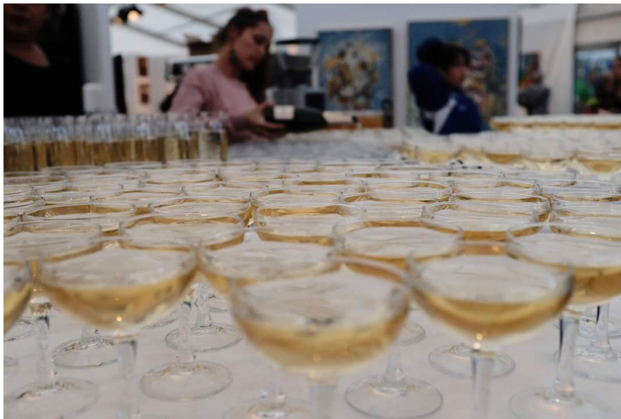
Cavaen flommet på åpningsfesten.